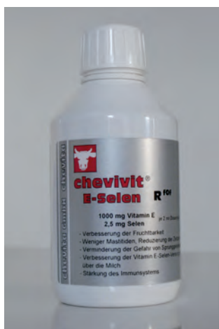
Abb. 4: Chevivit E-Selen® biotaugliches Ergänzungsfuttermittel – enthält Vitamin E und Selen

Futtermittel sind eindeutig auf der Verpackung und/oder auf dem Sackanhänger als solche gekennzeichnet, auch jene, die von Tierärzten abgegeben werden (z. B. Ergänzungsfuttermittel, Diätfuttermittel).