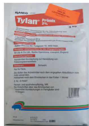
Abb. 7: Tylan – Arzneimittel mit Antibiotika

Tylan ist ein Arzneimittel, Flushing ist ein nicht biotaugliches Ergänzungsfuttermittel.