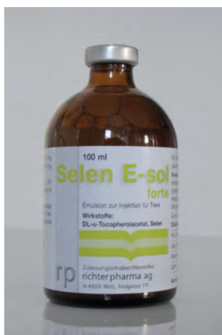
Abb. 5: Selen E-sol®-Arzneimittel – enthält Vitamin E und Selen

Das Injektionspräparat Selen E-Sol® (rechts, Abb. 5) ist ein Arzneimittel, während das über das Maul zu verabreichende Präparat Chevivit E-Selen® (links, Abb. 4)