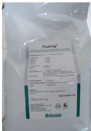
Abb. 6: Flushing – Ergänzungsfuttermittel

zwar ebenfalls Vitamin E und Selen als Wirksubstanzen enthält, aber als biotaugliches Futtermittel eingestuft ist.