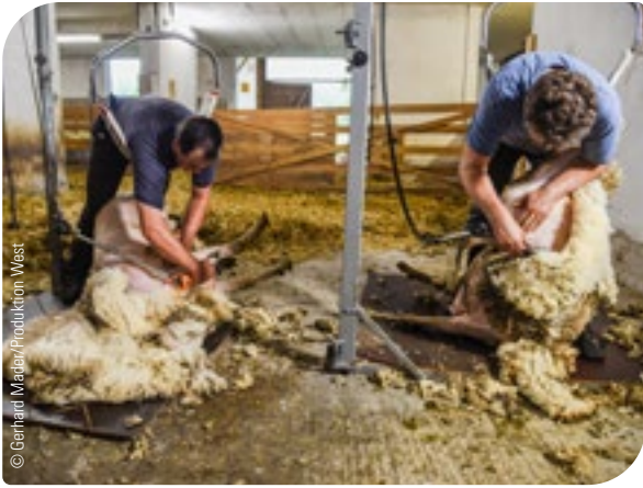
Abb. 14: Schafe müssen mindestens einmal (besser zweimal) pro Jahr vollständig geschoren werden.

Wollschafe, die bei den meisten Rassen genetisch bedingt keinen Wollwechsel aufweisen, müssen mindestens einmal (besser zweimal) pro Jahr vollständig geschoren werden. Unterbleibt die regelmäßige Schur, wird die Wolle schwerer, luftundurchlässiger und verfilzt. Dies schränkt u. a. das Wohlbefinden der Tiere ein, stört ihr Wärmeregulationsvermögen, verstärkt die Parasitenbelastung etc. Die Schur sollte mit einer Schermaschine mit intakter, scharfer Klinge durchgeführt werden, wobei Reinigungsmittel für das Schermesser und Wundspray für etwaige Verletzungen stets griffbereit sein sollten. Eine gute Vorbereitung verhindert unnötigen Stress nicht nur beim Tier. Die Biosicherheit ist bei der Schur essenziell und unbedingt einzuhalten. Oberste Priorität dabei hat die Desinfektion der Geräte. Eine weitere wichtige Maßnahme ist die Gruppierung der Herde – betriebsfremde oder kranke Tiere sind am Schluss zu scheren, um die Übertragung möglicher Krankheiten zu verhindern.