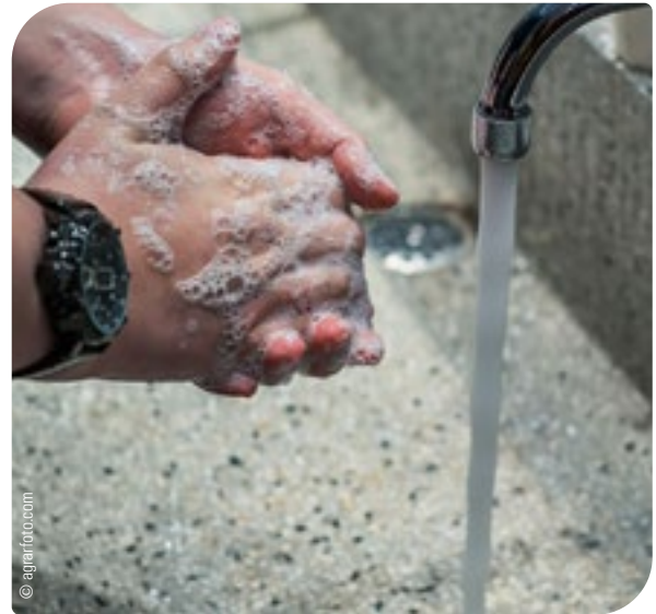
Abb. 7: Das Tragen sauberer Arbeitskleidung sowie das regelmäßige Waschen der Hände, am besten auch mit anschließender Desinfektion, sind empfohlen.