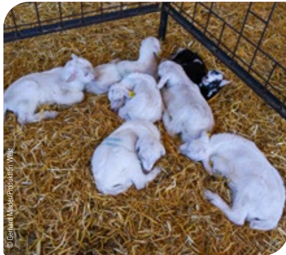
Abb. 18: Einstreu und Futterreste, z. B. im Lämmerbereich – Lämmer schlupf, sind mögliche Fliegenester. Daher soll die Einstreu regelmäßig erneuert und der Bereich regelmäßig gereinigt und desinfiziert werden.

Ausmisten und Erneuern der Einstreu, das Entfernen von Futterresten und die Eliminierung anderer etwaiger Brutplätze.