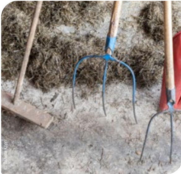
Abb. 6: Es ist notwendig, für den Quarantänestall eigene Gerätschaften zu verwenden.