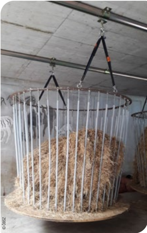
Abb. 19: Futterraufe zur Verringerung der Kontamination und damit des Infektionsrisikos

Bei der Futtermittelhygiene soll auf die Dokumentation des Futtermittelverkehrs geachtet werden. Bei Handelsfuttermitteln erfüllen Sackanhänger, Lieferscheine und Rechnungen diese Anforderungen. Für An- und Verkäufe von Futtermitteln zwischen Landwirten wird empfohlen, einen Futtermittellieferschein zu verwenden, das erleichtert auch die Rückverfolgbarkeit und etwaige Reklamationen.