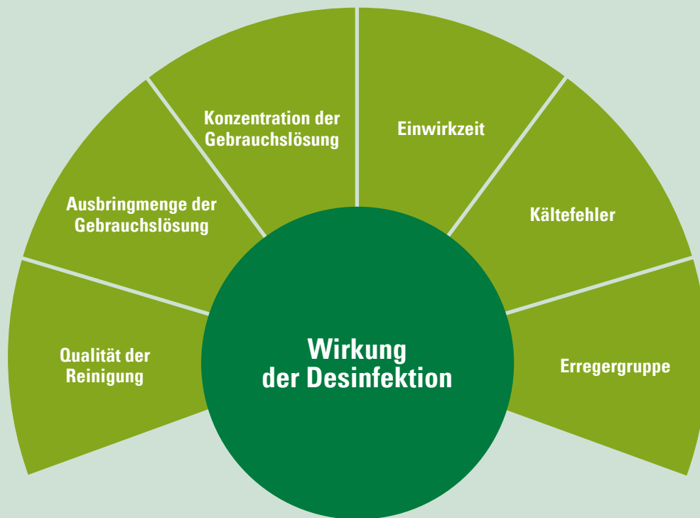
Abb. 17: Einflussfaktoren auf die Wirkung der Desinfektion