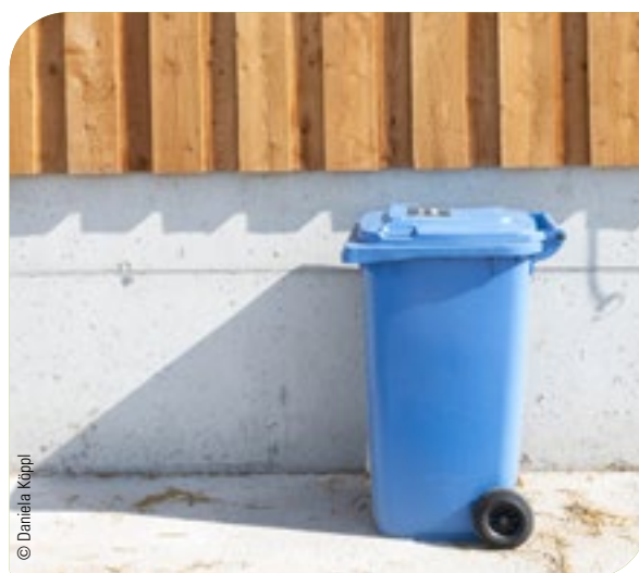
Abb. 16: Auch Schlachtreste, Organ-, Abortusmaterial und Nachgeburtsteile müssen ordnungsgemäß entsorgt werden.