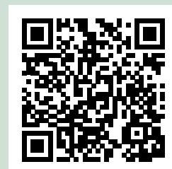
Tabelle 1: Übersicht Desinfektionsmittel und Anwendungsbeispiele. Weitere Informationen unter https://www.desinfektion-dvg.de/index.php?id=2150