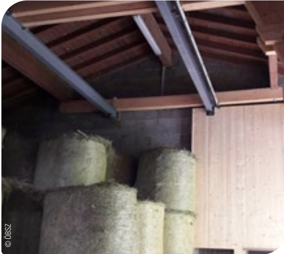
Abb. 21: Die Lagerung von Futtermitteln soll in sauberen und trockenen Bereichen erfolgen.