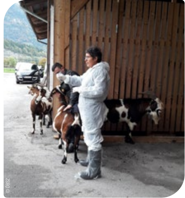
Abb. 3: Betriebsfremde Personen dürfen nur mit Schutzkleidung den Stall betreten.