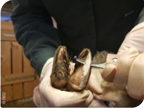
Abb. 13: Klauenpflugeschnitt und Kontrolle der Klauen vor Alpung – Tiere, die an Moderhinke erkrankt sind, sind von Sömmerung auszuschließen.