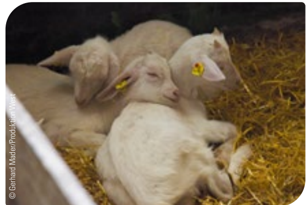
Abb. 5: Arbeitsablauf mit Jungtieren beginnen.