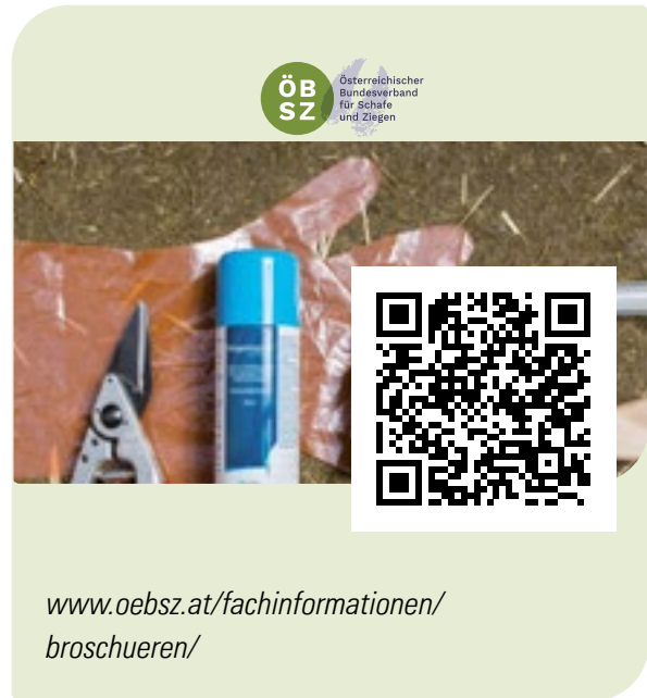
Abb. 11: Weitere Infos über Parasitosen sind auf dem YouTube-Kanal „WISSENswertes über Schaf- und Ziegenhaltung“ zu finden.

www.oebisz.at/fachinformationen/broschueren/