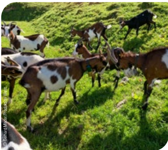
Abb. 15: Besonders bei Ziegen ist zu beachten, dass es sowohl bei der Herausnahme als auch nach der Wiedereingliederung genesener Tiere in die Gruppe zu starken Rangordnungskämpfen kommen kann.

Besonders bei Ziegen ist zu beachten, dass es sowohl bei der Herausnahme als auch nach der Wiedereingliederung genesener Tiere in die Gruppe zu starken Rangordnungskämpfen kommen kann. Das sollte bei der Beurteilung, ob eine Separierung von erkrankten Tieren notwendig ist oder ob die Behandlung in der Gruppe erfolgen kann, mit beachtet werden.