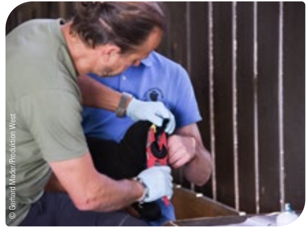
Abb. 10: Verpflichtende Kennzeichnung von Schafen und Ziegen

Verwendete Fesselbänder und Transponder sind vom Verfügungsberechtigten nach dem Tod bzw. der Schlachtung des damit gekennzeichneten Tieres unschädlich zu vernichten.