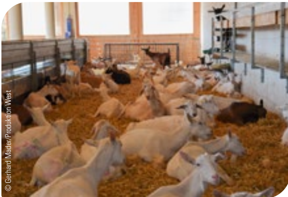
Abb. 4: Generelle Sauberkeit im Betrieb ist wichtig.