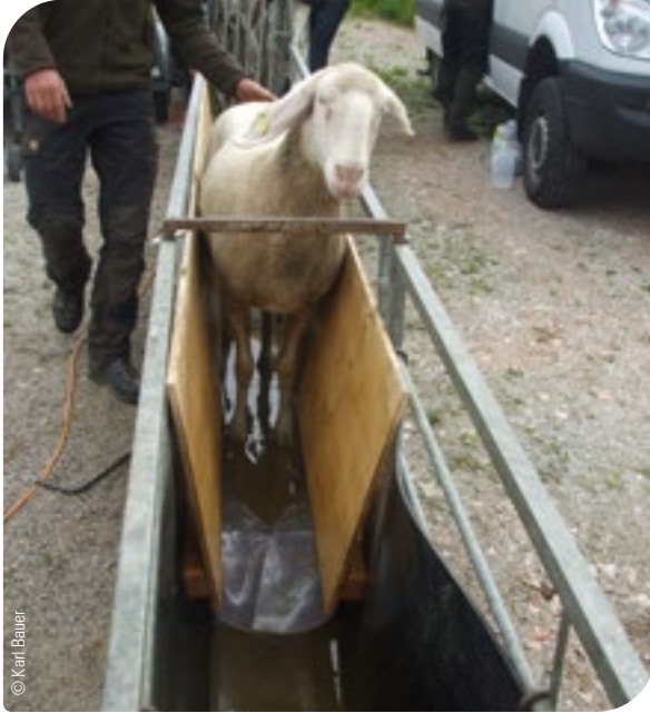
Abb. 2: Anwendung von Klauenbädern zur Vorbeugung von infektiösen Klauenerkrankungen